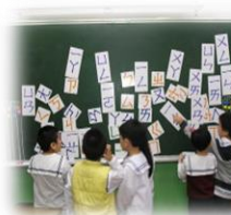
課程闖關體驗活動