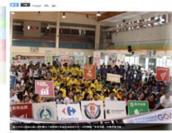
與企業合作 食育教育