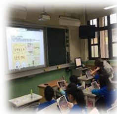
應用資訊媒材 平板線上教學