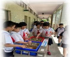
營養午餐打菜 井然有序