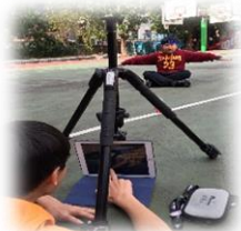
校園動起來拍攝活動