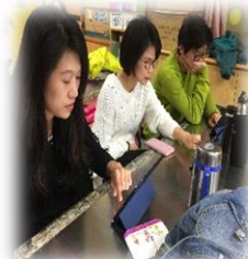
教師領域共備探究 創新教學方法