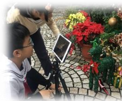
校園動起來拍攝活動