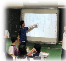
科技媒材課程分享