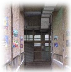
廊道多元學習 情境布置