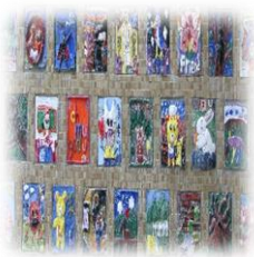
校園情境營造 學生學習成果