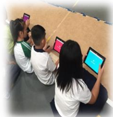
運用 Kahoo 進行 搶答活動