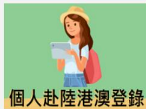
個人赴陸港澳登錄