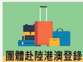
團體赴陸港澳登錄